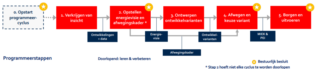
Afbeelding: Schema Integraal Programmeren